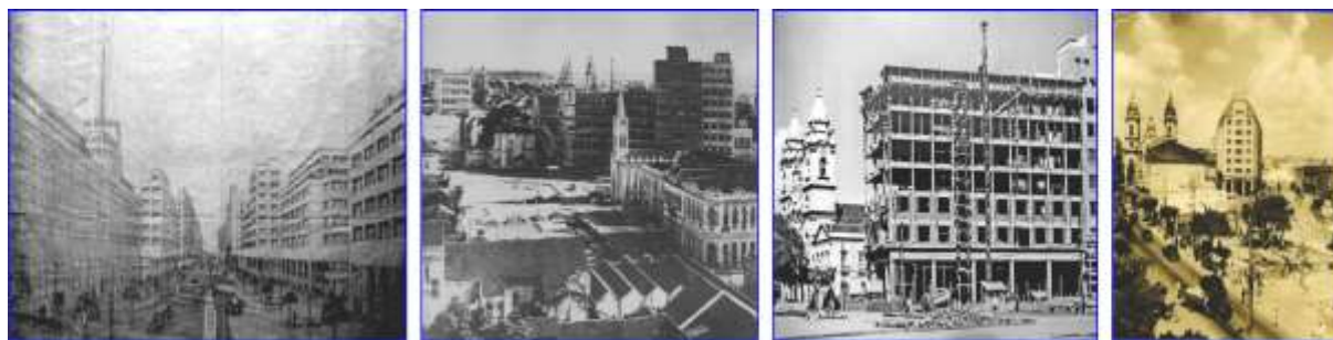
Fig. 4, 5, 6 e 7. Da esquerda para direita: (Fig. 4) Projeto de construção da Av. Guararapes e urbanização da região; (Fig. 5) Demolição do Pátio do Paraíso; (Fig. 6) Construção do Edifício Sulacap na Av. Guararapes; (Fig. 7) Praça da Independência e obras de construção da Av. Guararapes.

Ainda na década de 1920, durante o governo de Sérgio Loreto (1922-1926), pontes e avenidas foram construídas para interligar a área central insular da cidade à parte continental e suburbana do Recife. Neste período, podemos destacar, também, a construção das avenidas Herculano Bandeira e Beira Mar, atual Av. Boa Viagem, que tinha como principal objetivo garantir o acesso à estação balneária de Boa Viagem.