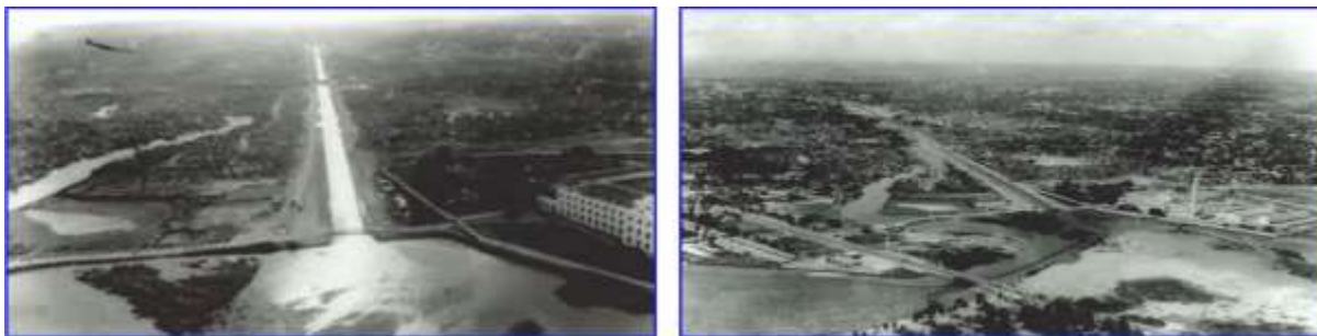
Fig. 8 e 9. Canal Derby-Tacaruna. Da esquerda para direita: (Fig. 8) Na década de 1960; (Fig. 9) Na década de 1970.