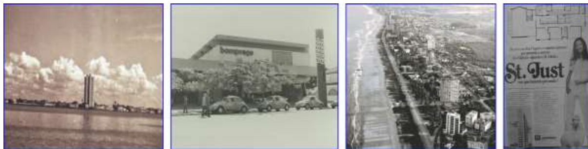
Fig. 10, 11, 12 e 13. Os novos emblemas da sociedade de consumo. Da esquerda para a direita: (Fig. 10) Edifício Capibaribe, onde ficava o apartamento de Cláudio Arantes do Nascimento ; (Fig. 11) Supermercado Bompreço, localizado no bairro da Madalena e inaugurado em 1967; (Fig. 12) Praia de Boa Viagem, nova área de investimentos imobiliários em finais da década de 1960; (Fig. 13) Propaganda de apartamentos em edifício no bairro de Boa Viagem. Ano de 1973.

Cláudio Arantes do Nascimento é um bancário de meia-idade e nas horas vagas faz trabalhos de contabilidade para recompor as finanças do orçamento familiar. Ante a ambição social da mulher e das filhas, é forçado a vender a sua residência própria e deixar a vida no pacato bairro da Madalena e se vê cada vez mais pressionado a atender as demandas e ambições da família para a aquisição de um apartamento no Edifício Capibaribe. Para atendê-las, além da venda da casa própria, contrai dívidas para poder comprar o apartamento. Mas o seu sacrifício não teve nenhuma retribuição: na hora da debandada do edifício, a mulher e as filhas, em vez de ficarem ao lado dele, debandam também, deixando-o totalmente só.