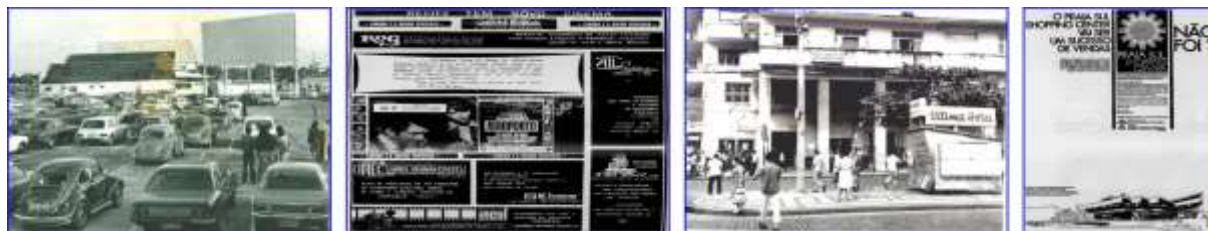
Fig. 14, 15, 16 e 17. Outros emblemas da sociedade de consumo. Da esquerda para a direita: (Fig. 14) Cine Drive-In - Aeroclube de Pernambuco, década de 1970; (Fig. 15) Propaganda de inauguração do Cinema Veneza, em 27 de dezembro de 1970; (Fig. 16) Banca Globo, localizada na Av. Guararapes, que durante muito tempo foi o principal local de venda de revistas e jornais de circulação nacional; (Fig.17) Propaganda da construção e vendas de lojas do Praia Sul Shopping Center, um dos primeiros do Recife.

Com a consolidação da sociedade de consumo no Recife se constituíram e se expandiram grandes empresas no setor financeiro, como o Banorte, e, também, as primeiras redes locais de supermercados (Comprebem e Bompreço), concorrendo com o comércio tradicional do centro da cidade e das mercearias de bairro. Por outro lado, as gestões de caráter técnico-rationais e de eficiência empresarial passaram a marcar a administração da cidade pós-64 e criaram um mercado para empreiteiras com as sistemáticas intervenções na paisagem urbana e fomentaram a especulação imobiliária com os projetos de reurbanização na cidade, favorecendo a destinação de áreas nobres e estratégicas para o mercado imobiliário, direcionado aos segmentos sociais de alto poder aquisitivo (BERNARDES, 1996, p. 75-83).