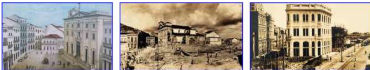
Fig. 1, 2 e 3. Da esquerda para a direita: (Fig. 1) Litografia da Igreja do Corpo Santo no século XIX; (Fig. 2) Demolição da Igreja do Corpo Santo e construção da Praça Rio Branco; (Fig. 3) Construção da Avenida Rio Branco e o primeiro prédio construído na avenida.

adequando-os e ampliando-os às demandas e aos interesses alinhavados sob o signo do progresso, isto é: a circulação da mercadoria em uma cidade inserida de forma cabal no processo de reprodução e acumulação ampliado do capital em nível mundial.