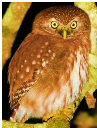
Konhko – Caburé do sol