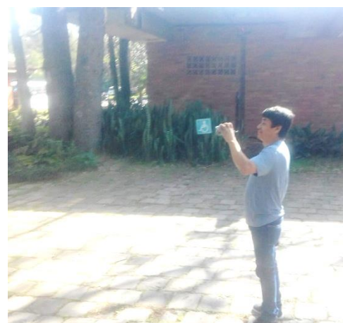
Passeio ao zoológico, 2018