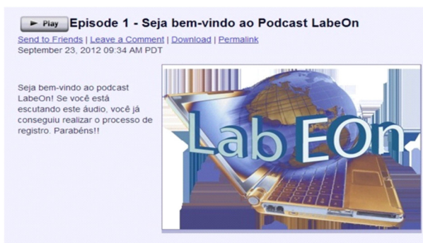
Figura 2. Episódio 1 Podcast LabEOn.