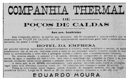
Figura 1. Propaganda Companhia Thermal de Poços de Caldas. Figure 1. Advertising of Companhia Thermal de Poços de Caldas.