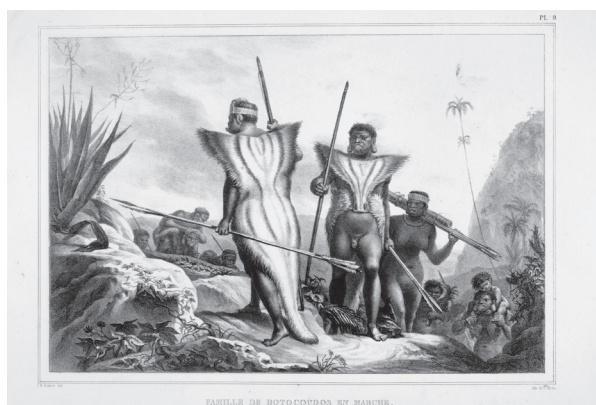
Figura 6: Jean-Baptiste Debret Famille de Botocoudos en marche (Família de Botocudos em passeio)