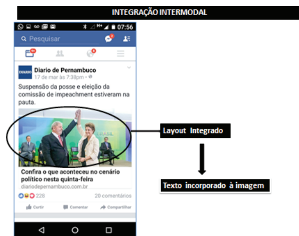
Figura 1. Exemplo de layout integrado.

Ao perceber o que explicita o exemplo 2, notamos que a comunicação visual desse tipo de layout não só representa o mundo, mas também estabelece uma interação com texto verbal e visual em espaços distintos, constituindo-se, assim, um tipo de texto reconhecível e dotado de uma unidade signi-