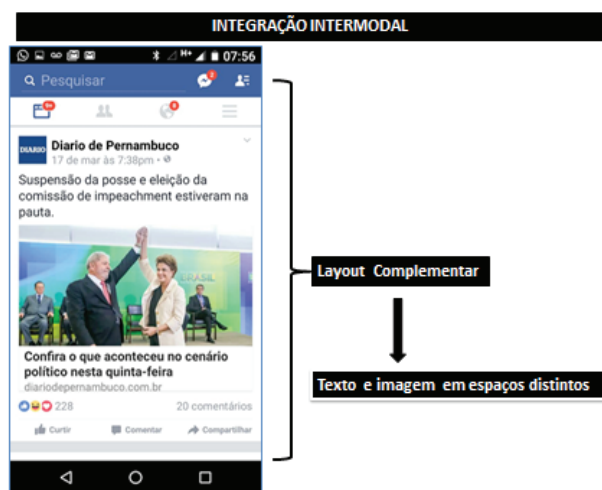
Figura 2. Exemplo 2 de layout complementar. Figure 2. Example 2 of complementary layout.